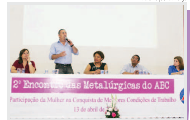
2º Encontro das Metalúrgicas do ABC Participação da Mulher na Conquista de Melhores Condições de Trabalho 13 de abril de 2012

Durante o encontro, as companheiras formularam e aprovaram propostas para a área de saúde e estratégias para ampliar a presença feminina nas fábricas. (Veja quadro abaixo).