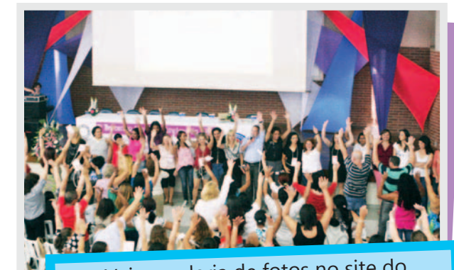
Veja a galeria de fotos no site do Sindicato em smabc.org.br